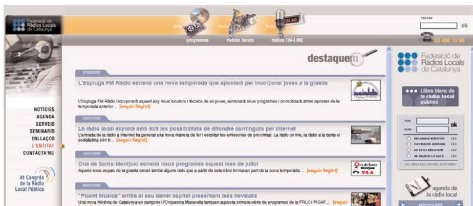
El premi va ser gràcies a la iniciativa de promoure la confecció del primer Llibre Blanc de la Ràdio Local Pública

Tots els programes en català difosos arreu dels territoris de parla catalana, sense cap altra condició que la que haguessin estat emesos entre el setembre de l'any 2008 i el 15 de juliol de l'any 2009, van poder optar als premis ràdio associació 2009.